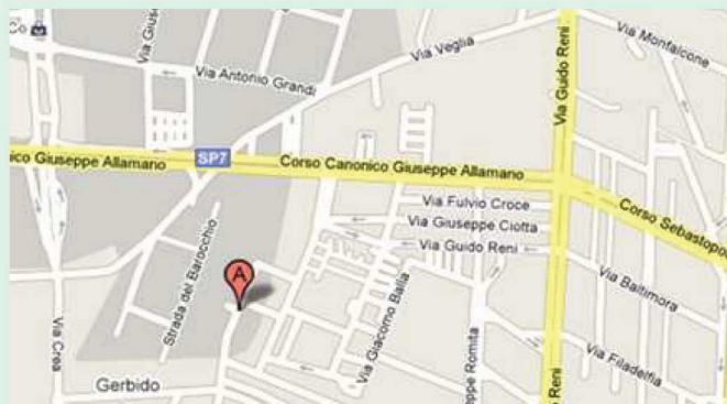
Localizzazione impianto Palatucci

oppure direttamente sul posto il giorno della manifestazione