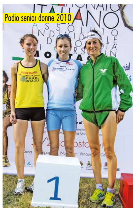
Podio senior donne 2010